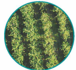
Discolorazioni (patogeni), Densità e Conta delle Colture