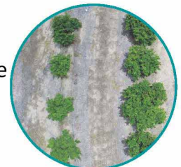
Stadi di Crescita delle Piante